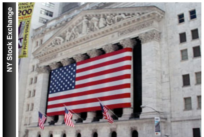
NY Stock Exchange