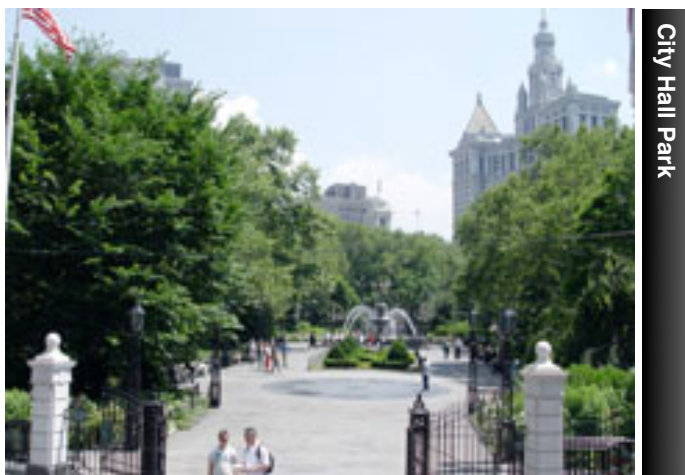
City Hall Park

Proseguimos hacia el Norte por Nassau St. A mano derecha, en el cruce con Liberty St. encontramos la Reserva Federal , que es considerado el mayor depósito de lingotes de oro del mundo. Ofrece visitas gratuitas (se recomienda reserva). Continuamos hasta Fulton St. donde giraremos a la izquierda para llegar a Broadway. Inmediatamente vemos St. Paul's Chapel . Convertida en símbolo tras el 11/S, esta pequeña capilla sobrevivió a los atentados para servir de cobijo a los servicios de emergencia y familiares de las víctimas. A escasos metros, una de las joyas de la ciudad en forma de rascacielos: el 8 Woolworth Building , de 241 metros e inspirado en las catedrales góticas. Frente a él, City Hall Park es un tranquilo parque que en su parte norte alberga el ayuntamiento de Nueva York. Es aquí donde finalizaremos nuestro recorrido por Downtown.